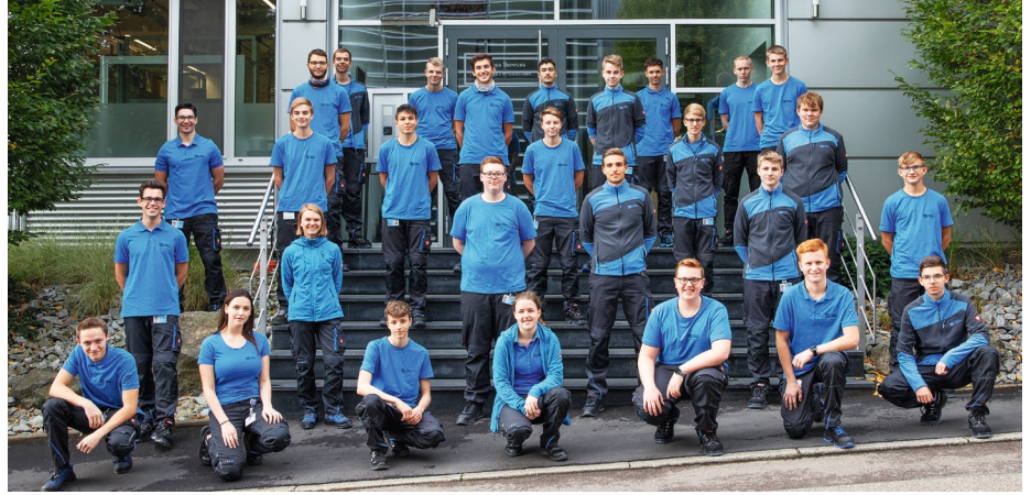
26 Auszubildende und elf dual Studierende begannen im Herbst bei Harro Höfliger.

I m Herbst hat für 26 Auszubildende sowie für elf Studierende an der Dualen Hochschule Baden-Württemberg (DHBW) der Arbeitsalltag bei Harro Höfliger begonnen. Seit fast 40 Jahren ist die Ausbildung des eigenen Nachwuchses fest im Unternehmen etabliert. In dieser Zeit haben über 500 Fachkräfte ihre Berufsausbildung erfolgreich abgeschlossen. Die Fertigkeiten in der Metallverarbeitung und der Elektro- und Steuerungstechnik für den Maschinenbau werden in einem eigenen Ausbildungszentrum, der HH Academy, intensiv vermittelt. Das praxisnahe Studienangebot reicht vom Maschinenbau über die Elektro- und Informationstechnik bis hin zum Internationalen Technischen Vertriebsmanagement.